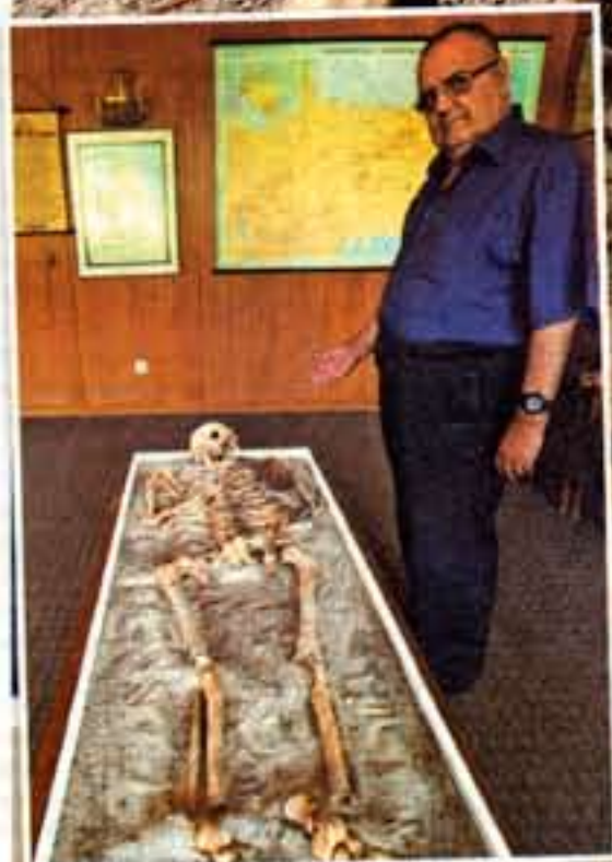
Проф. Божидар Димитров: